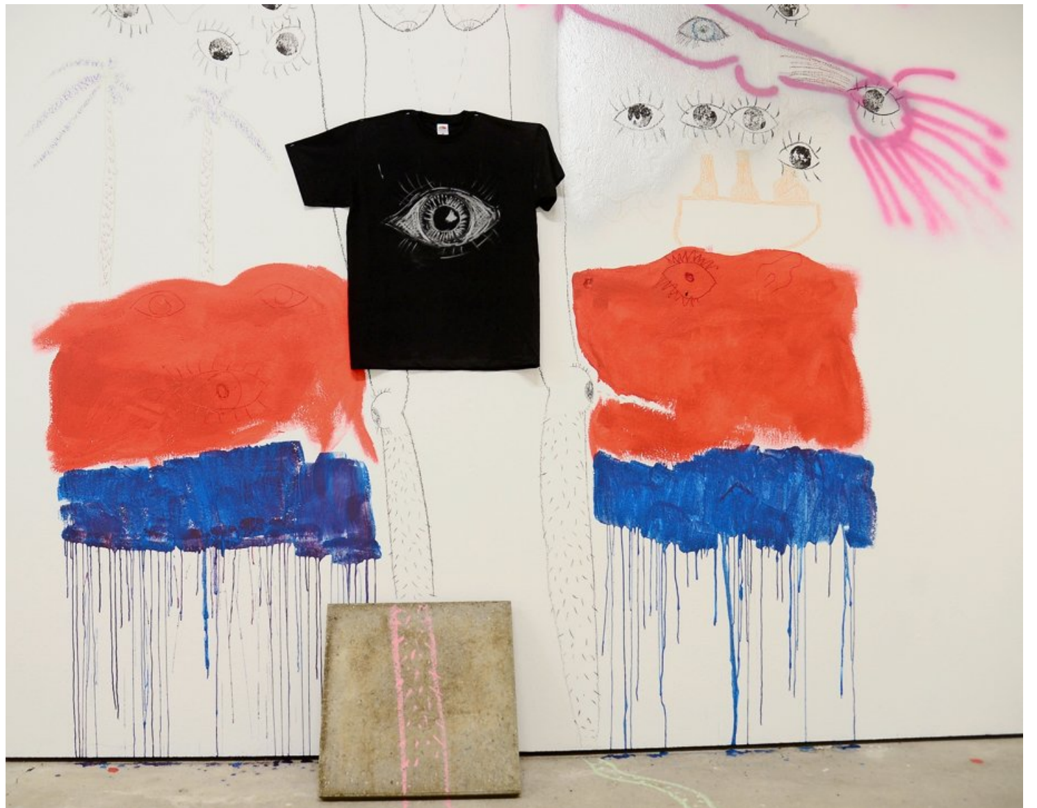
Spielerisch und schräg: Installation des Künstlerduos Fructuoso/Wipf im Untergeschoss des Oxyd.

Ein Bild, das kann sich jeder knipsen und rasch ausdrücken, oder er kann es malen und im Internet auf Wegwerfmöbel oder -mülleimer drucken lassen, die man für Veranstaltungen gebrau-